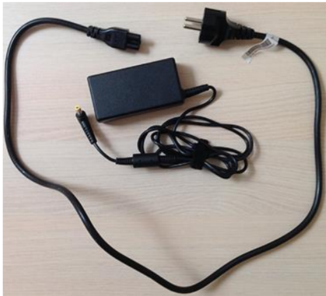
1 Câble d'alimentation (2 parties)