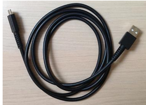
4 Câble USB pour manettes