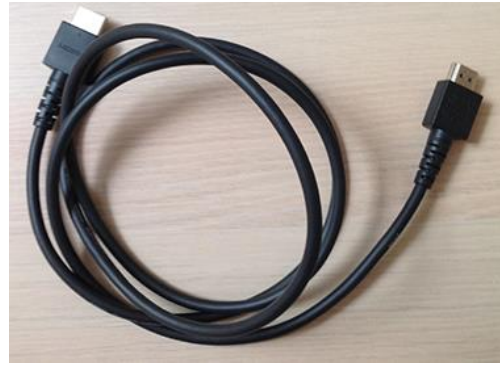
1 Câble HDMI