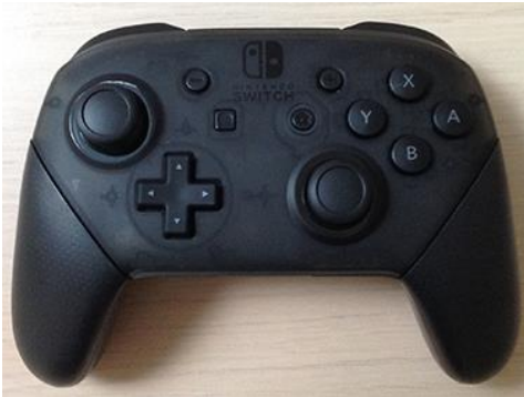
4 manettes pro