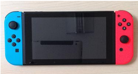
1 console + 4 joy-con