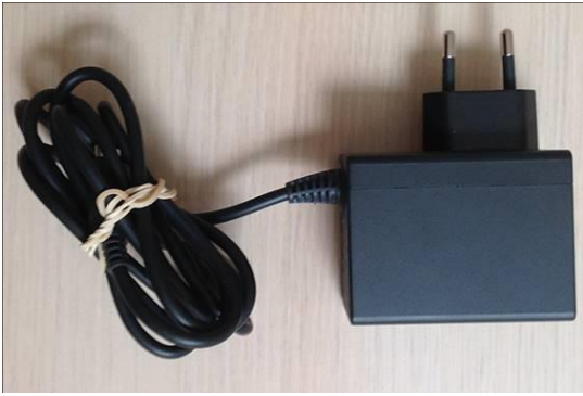
1 Câble alimentation