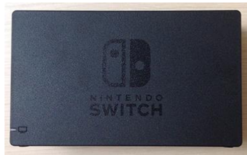
1 dock support pour console