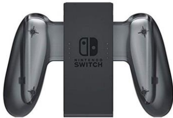
2 supports manettes