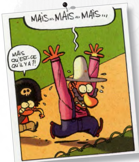
Tralaland - Libon (Bayard éditions)