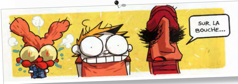
La vie en slip - Baker (éd. Dupuis)