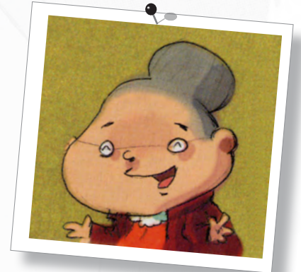
Mamette - Nob (éd. Glénat)