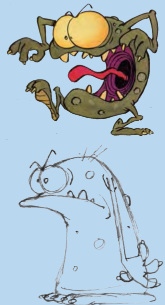
Kid Paddle - Midam (éd. Dupuis)