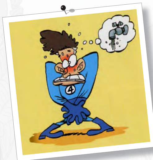
Captain Biceps - Zep et Tebo (éd. Glénat)

Il peut également jouer sur la position du corps pour accentuer l'expression du personnage et renforcer l'effet comique.