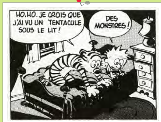
Calvin et Hobbes - Watterson (éd. Hors Collection)

À ton tour de créer des personnages et de les faire vivre à travers différentes positions, attitudes ou émotions.