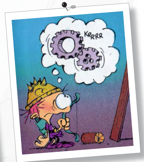
Kid Paddle - Midam (éd. Dupuis)

... il peut utiliser des idéogrammes ou des pictogrammes (ce sont des petits dessins que le dessinateur met dans des bulles ou au-dessus des personnages pour exprimer leurs sentiments ou leurs pensées).